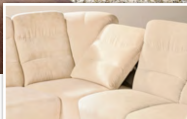
Relax-Eckteil: Beide Rückenpolster lassen sich in fünf bequeme und entspannte Ruhepositionen, entweder nach links oder rechts, verstellen.