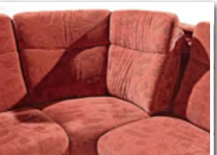
Rundteil, beidseitig verstellbar: In beide Richtungen können die Rückenpolster nach vorne geschwenkt werden.

Kompakte Wohnlandschaft mit „Raum-Spar-Effekt“