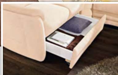
Bettkasten: Bei geschlossener Sockelausführung ist der Einbau eines Schubkastens im 2-Sitzer-Sofa möglich.

Mit 3 unterschiedlichen Armlehnausführungen, 3 Rückenoptiken, 2 Sitzhöhen und 3 unterschiedlichen Sitzhärten finden Sie Planungsspielräume in jeder Hinsicht.