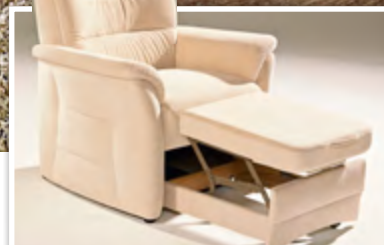
Sessel mit Fußauszug: Mit einem Handgriff lässt sich aus dem geschlossenen Sockel die Fußstütze ausziehen und hochschwenken.