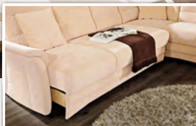
Vorziehssofa: Einfach den Sitz nach vorne ziehen und schon haben Sie eine komfortable Liegefläche in verschiedenen Größen.