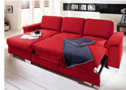
Longchair schmal und 2-Sitzer, in Stoff

Pragmatisch und nützlich zugleich. Zum Beispiel der Querschläfer , der eine großzügige Liegefläche erreicht – zum individuellen Preis erhältlich.