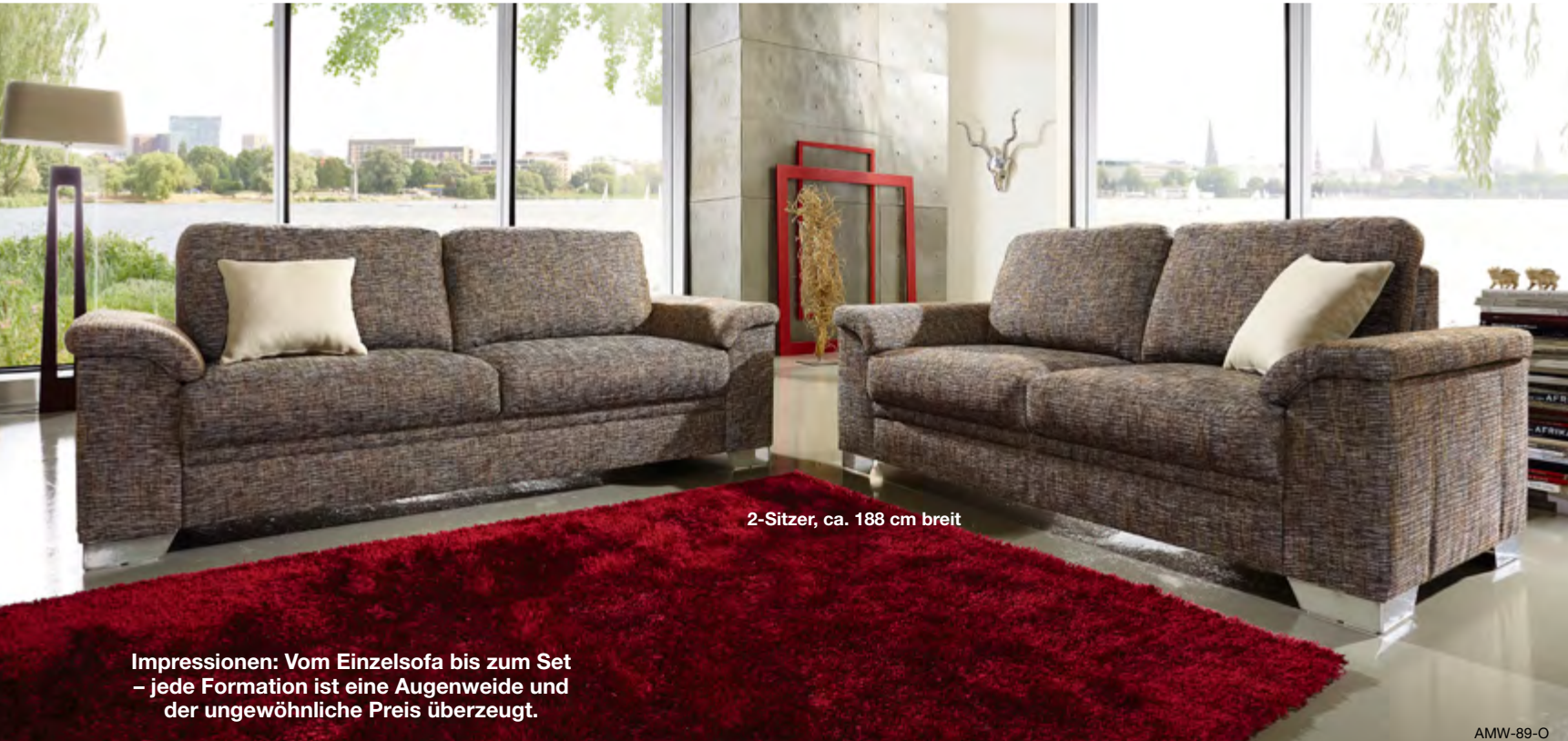
2-Sitzer, ca. 188 cm breit

Impressionen: Vom Einzelsofa bis zum Set – jede Formation ist eine Augenweide und der ungewöhnliche Preis überzeugt.